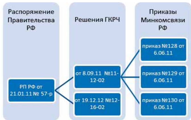
Рис. 2. Регуляторная основа развития экосистемы TD-LTE в России

повышающих зону охвата потребителей и снижающих затраты на создание сетей;