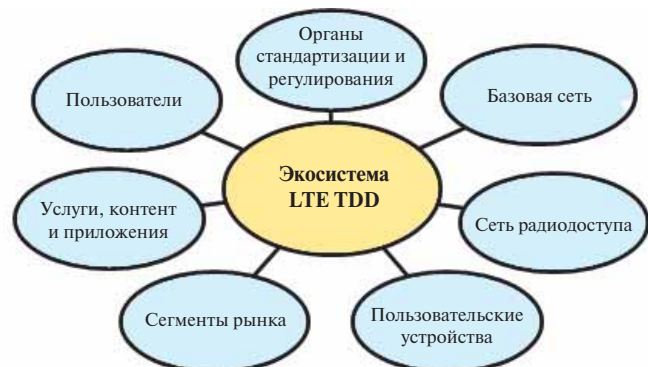
Рис. 1. Основные элементы экосистемы технологии TD-LTE